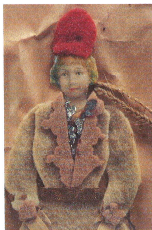
Bild 3: till höger vid figurens hals har en metallbit lossnat, metallbiten sitter fast på glaset längre ned