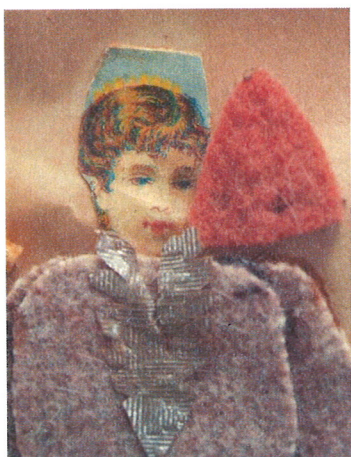
Bild 2: den röda applikationen som lossnat från sin plats, ska sitta som mössa på figuren bredvid